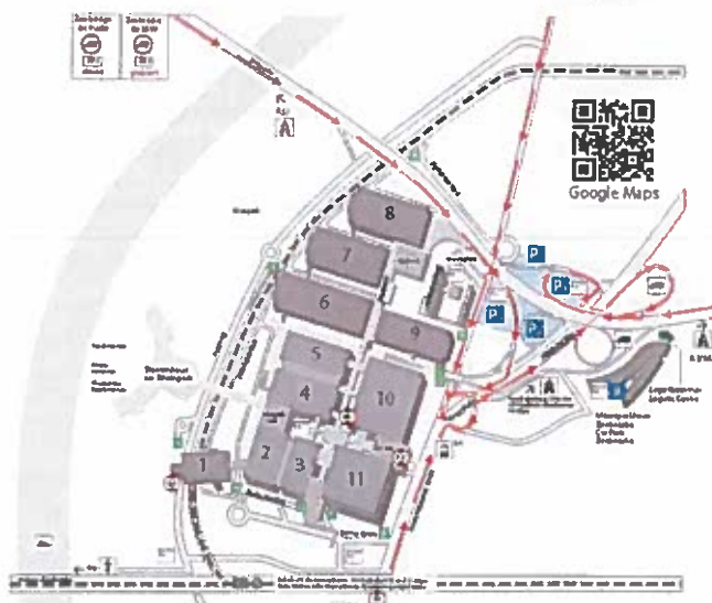
Verkehrslenkungsplan zum P22